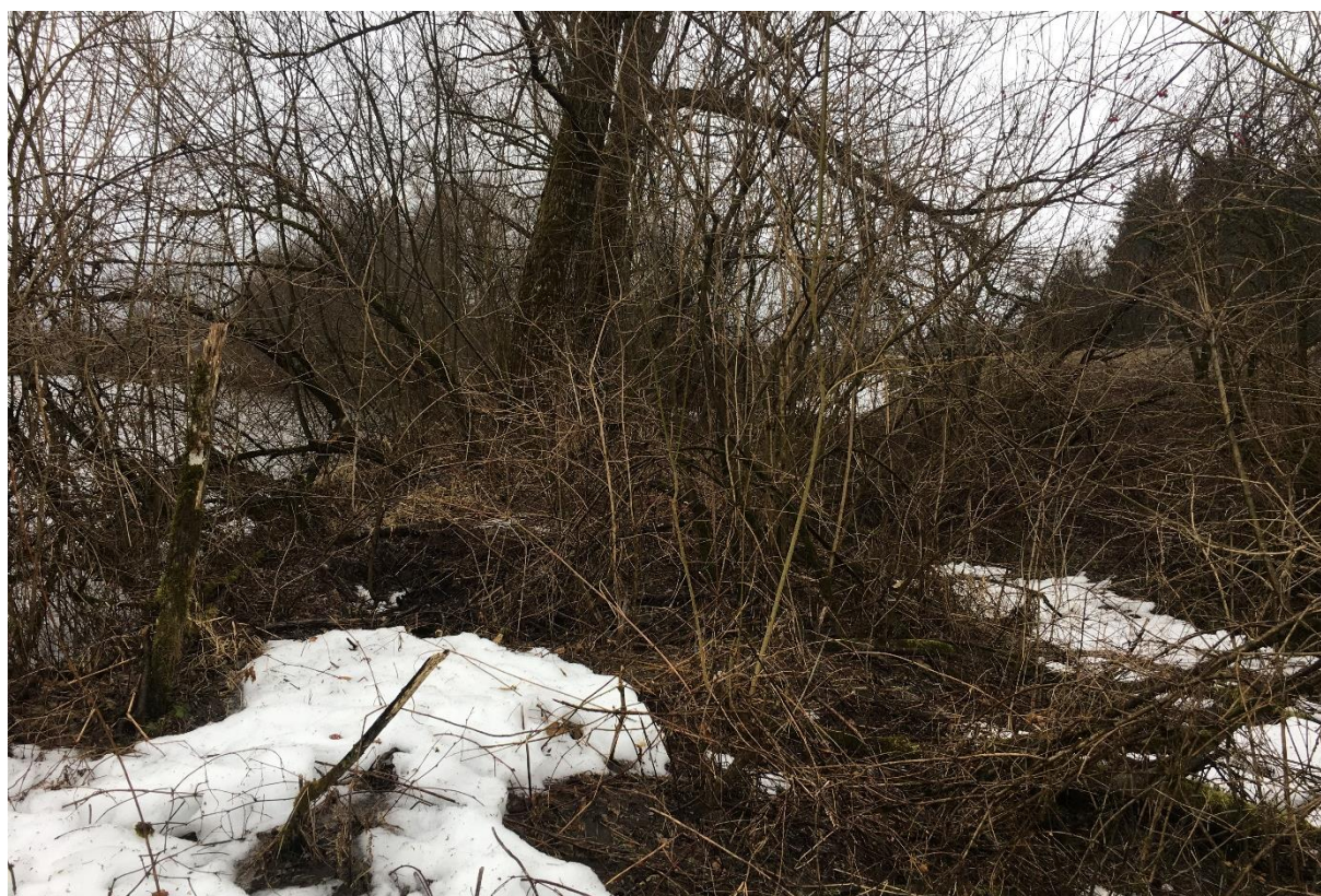
Abb. 5: Deich bei Fkm 25,00