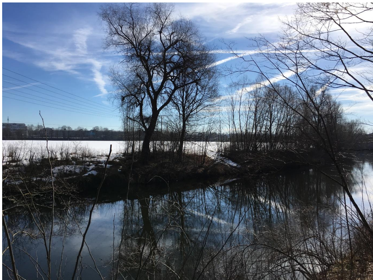
Abb. 1: Eingetieftes Gewässerbett bei Fkm 4,20