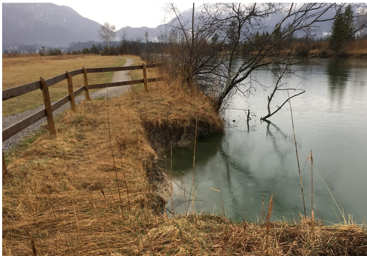
Abb. 4: Uferanbruch bei Fkm 42,95