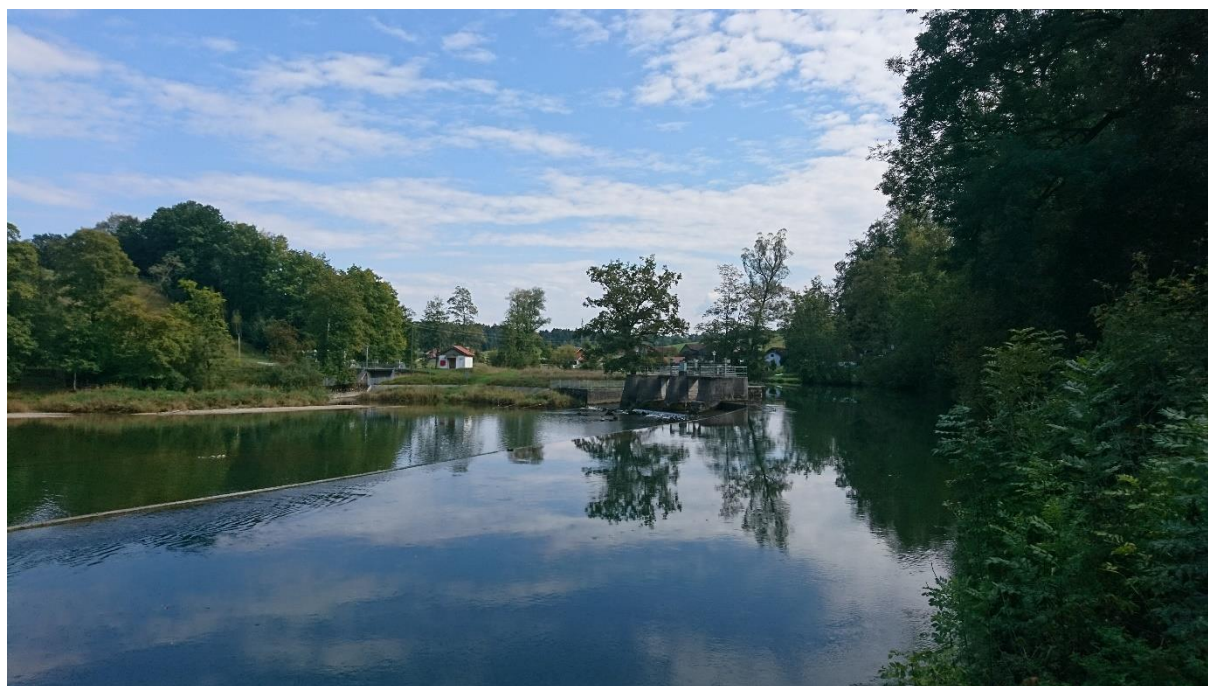
Abb. 11: Fehlende Durchgängigkeit bei Stauanlage Beuerberg bei Fkm 16,60