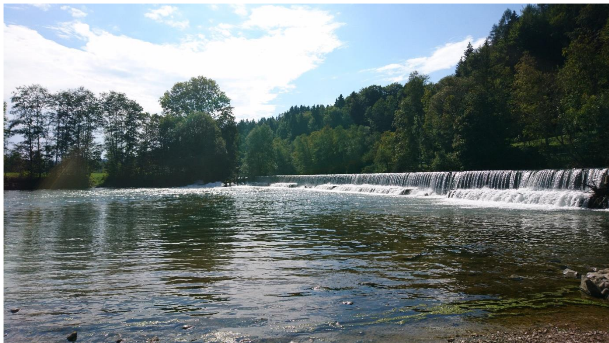
Abb. 10: Fehlende Durchgängigkeit bei Stauanlage Eurasburg bei Fkm 13,80