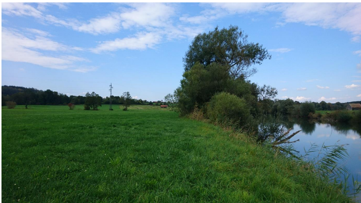
Abb. 13: Fehlender Gehölzsaum bei Fkm 19,20