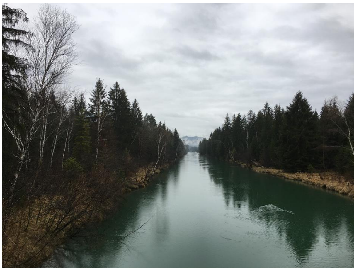
Abb. 3: Begradigung bei Fkm 42,214