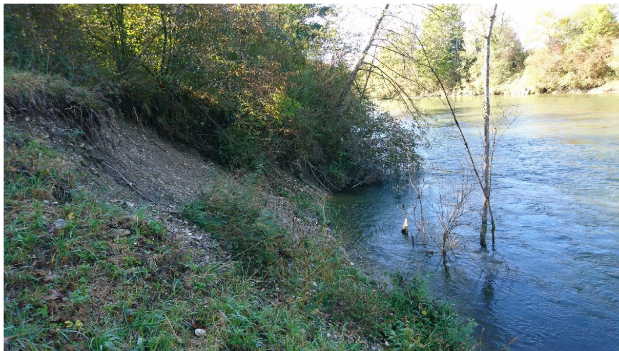
Abb. 2: Uferanbruch bei Fkm 28,80