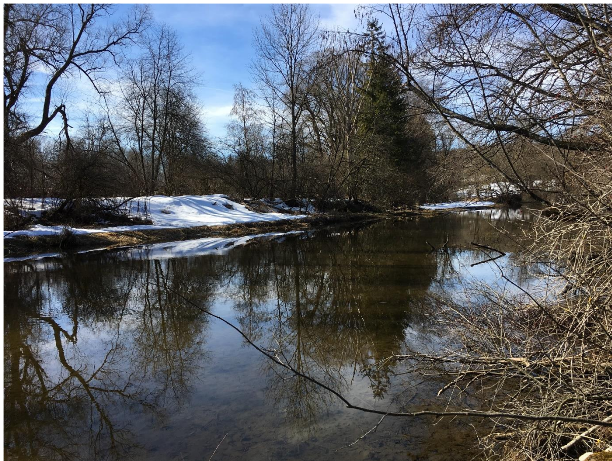
Abb. 6: Altarm bei Fkm 5,20