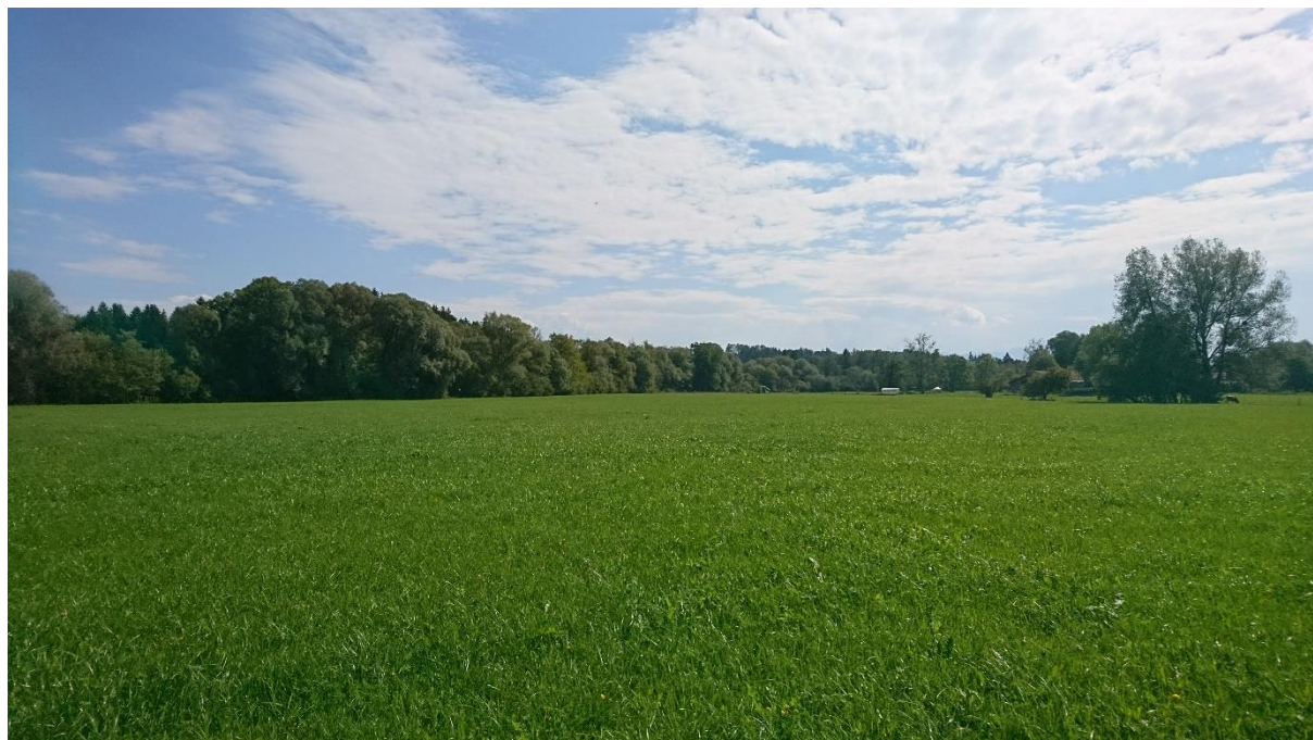
Abb. 8: Intensiv genutztes Grünland bei Fkm 10,10