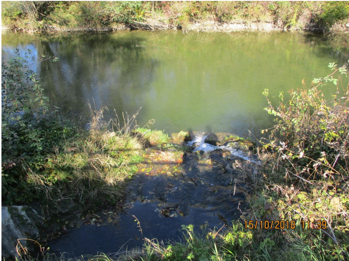
Abb. 12: Beispiel für nicht angeschlossenes Nebengewässer Kaltenbach bei Fkm 32,60