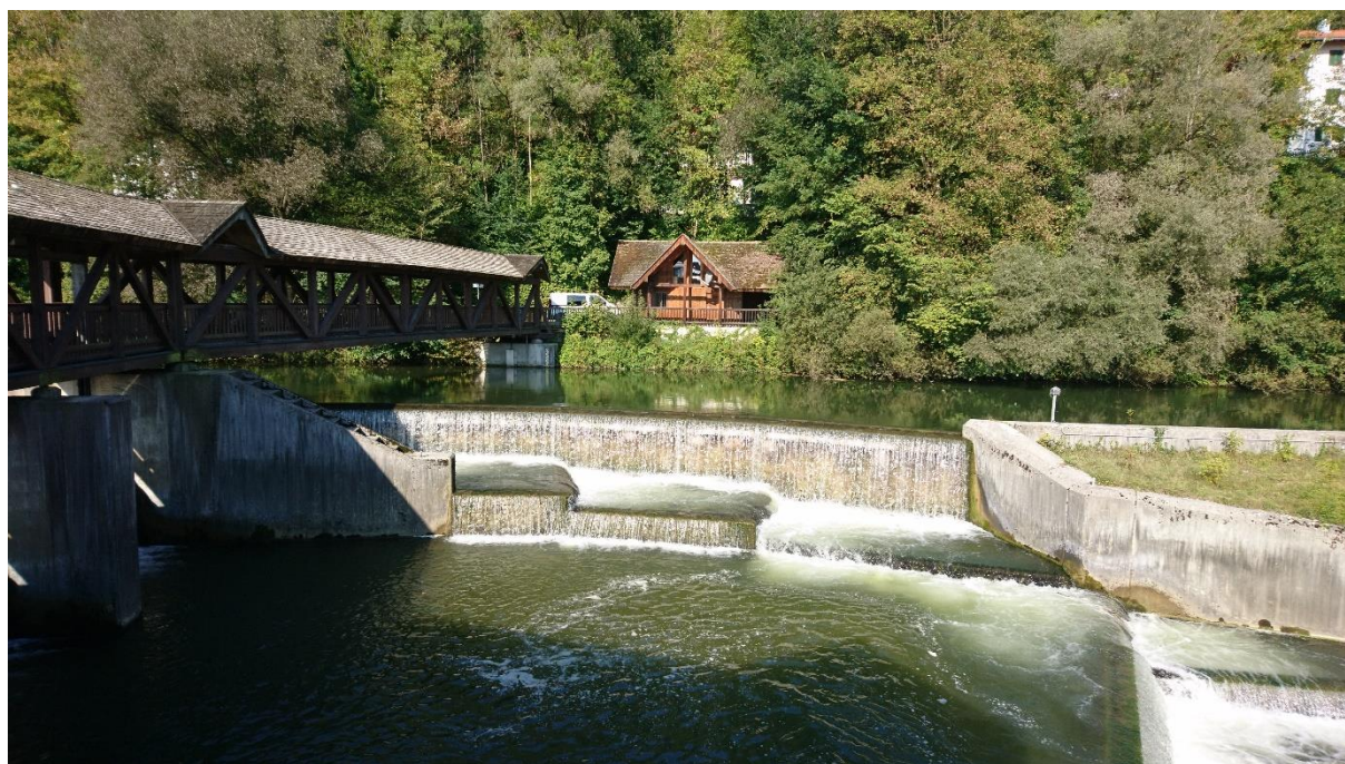
Abb. 9: Fehlende Durchgängigkeit bei Stauanlage Wolfratshausen bei Fkm 2,00